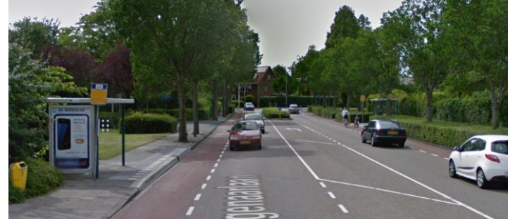
L. Johan Wagenaarlaan

Bus halteren op de fietsstroken is niet volgens de richtlijn voor gebiedsontsluitingswegen.