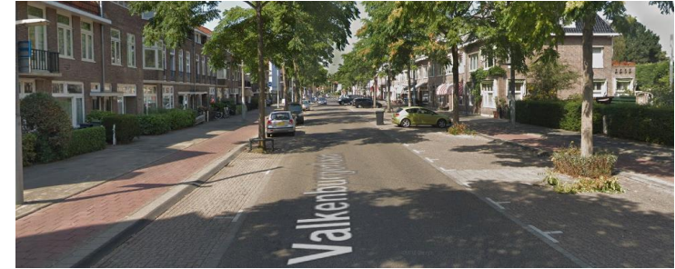
M. Valkenburgerlaan (ri Raadhuisplein)

Op een gebiedsontsluitingsweg dient minimaal rijrichtingscheiding in de vorm van ononderbroken asmarkering aanwezig te zijn.