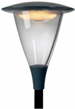
Figuur 1.1: Regulier