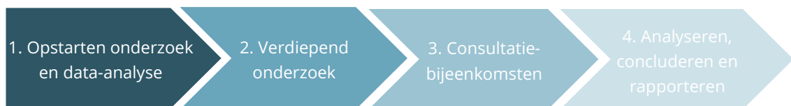
Figuur 1. Onderzoeksaanpak.