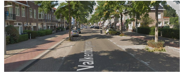
M. Valkenburgerlaan (ri Raadhuisplein)

Op een gebiedsontsluitingsweg dient minimaal rijrichtingscheiding in de vorm van ononderbroken asmarkering aanwezig te zijn.