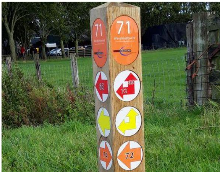
Voorbeeld van een knooppunt

Voor de inrichting van het wandelnetwerk wordt gebruik gemaakt van de reeds in de rest van het wandelnetwerk beproefde inrichting. Bewegwijzering vindt zoveel mogelijk plaats op bestaand straatmeubilair (door middel van stickers) en waar nodig worden houten berm paaltjes en knooppuntpaaltjes geplaatst. Op startpunten worden informatiepanelen geplaatst.