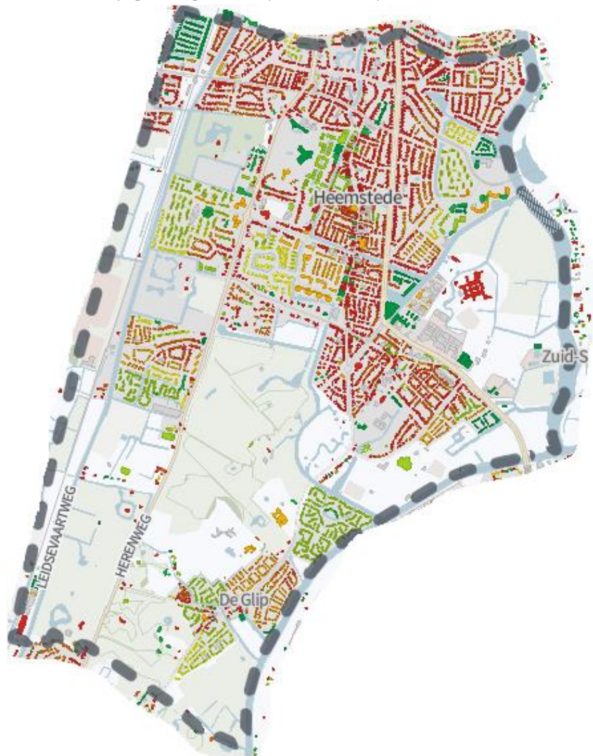
Kaart voorlopig energielabel (Heemstede)