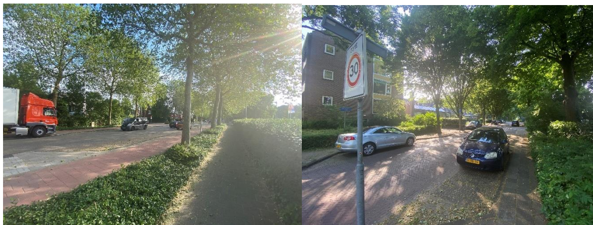
Straten en woningen langs het parkeerterrein

Vanwege deze omgevingskenmerken verwachten wij net als de gemeente zelf niet een significant effect op woongenot. Voor de omwonenden leiden de 2 alternatieven bijvoorbeeld niet tot grote wijzigingen in het uitzicht omdat het zich op de parkeerplaats nu als grotendeels ontnomen wordt door de huidige groene inrichting. Hooguit zit er een verschil in de communicatie rondom de alternatieven (zoals ook hierboven door de gemeente benoemd), maar wij verwachten niet dat dit leidt tot een significant effect op woongenot.