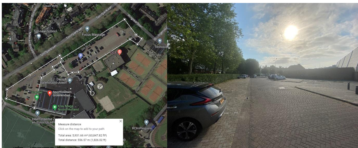
Locatie sportterrein (Google maps) en foto van het huidige terrein

Verder wordt het plangebied groener ingericht. Hoe dient nog door de gemeente te worden uitgewerkt. In onze kostenraming zijn we in samenspraak met de gemeente uitgegaan dat de volgende voorzieningen worden toegevoegd: