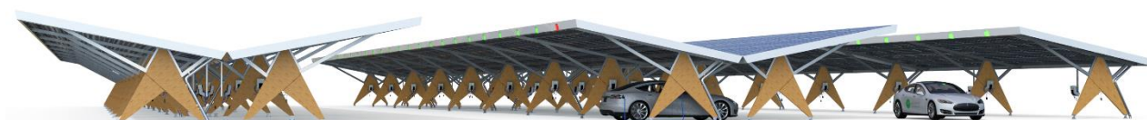
Impressie van een zonneparking met houten constructie

Het uitgangspunt is dat er naast bovengenoemde voorzieningen – mede op basis van reacties van omwonenden en angst voor overlast - geen extra recreatievoorzieningen worden gerealiseerd. Dit betekent dus dat er niet wordt uitgegaan van de realisatie van bijvoorbeeld houten speeltoestellen.