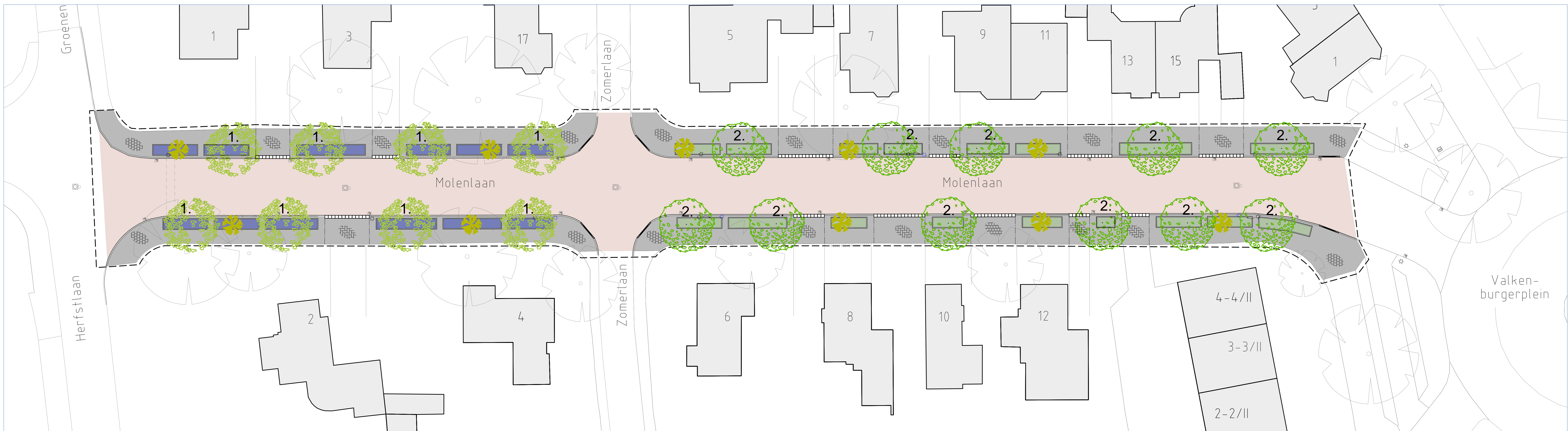
OVERZICHTSTEKENING SCHAAL 1:200