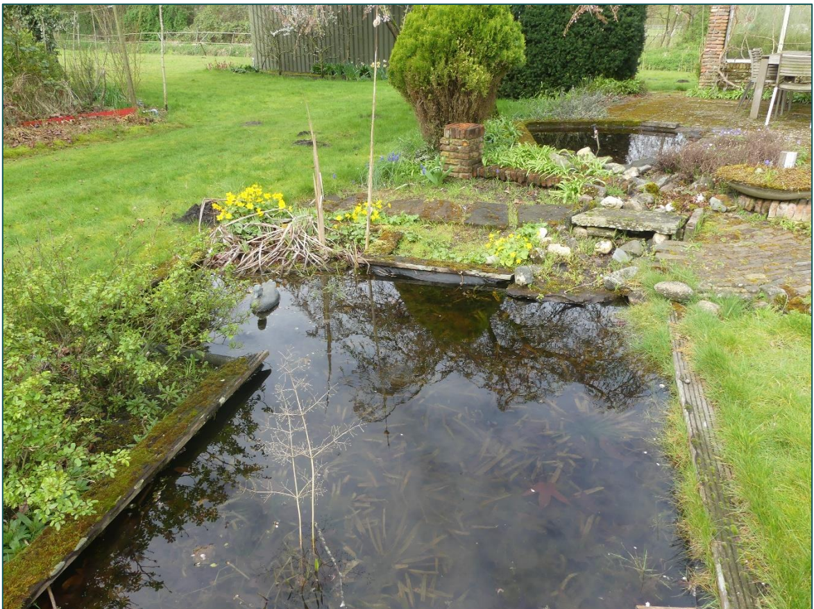
Figuur 4 Impressies van de vijvers die op de planlocatie aanwezig zijn. De vijver op de achtergrond is tot op 2cm volledig gevuld met bladeren.