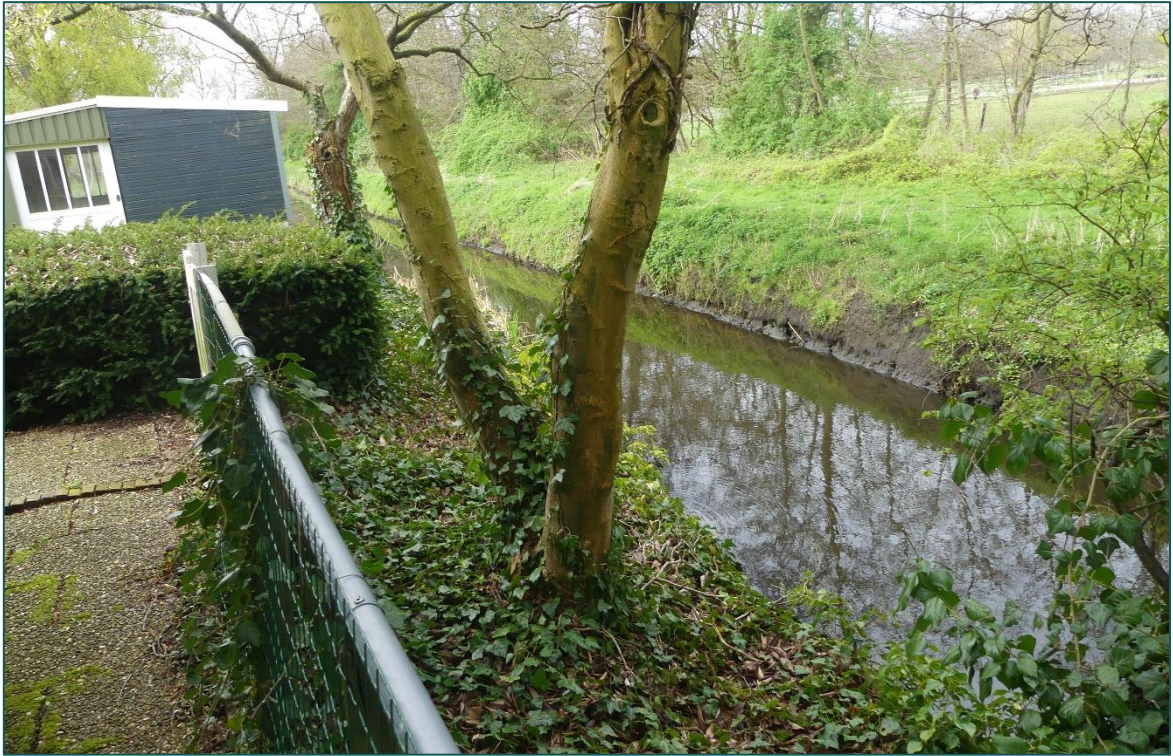
Figuur 3 Impressie van de sloot aan de noord- en westzijde van de planlocatie. De oever aan de planlocatie is volledig beschoeid.