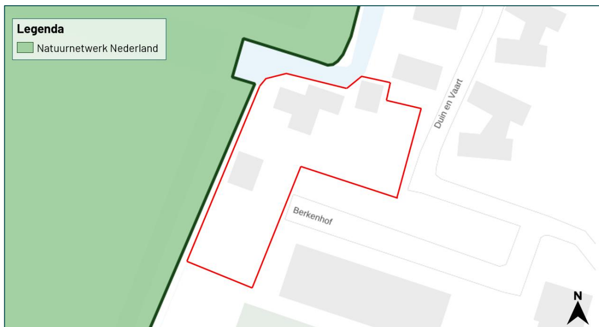
Figuur 3.5 De planlocatie grenst aan het Natuurwerk Nederland die betrekking heeft tot een deel van de watergang.