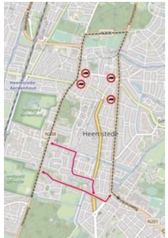
Figuur 1: Sluiproute doorgaand vrachtverkeer(roze) en gewenste route doorgaand vrachtverkeer (zwart gestippeld)

Het bestemmingsvrachtverkeer dient vanzelfsprekend wel de mogelijkheid te krijgen naar hun plaats van bestemming in en zo nodig door Heemstede, te rijden. Door deze verkenning wordt ook inzichtelijk welke omvang en welke routes het bestemmingsvrachtverkeer aflegt. Dit is met name bestemmingsverkeer voor de bevoorrading van de winkels langs de Binnenweg, Raadhuisstraat en Valkenburgerlaan. De te verwachten onderzoeksresultaten over de samenstelling en de routing van Heemsteeds bestemmings- en vrachtverkeer kan daarmee ook waardevol zijn voor een mogelijke distributie-hub voor de Raadhuisstraat-Binnenweg.