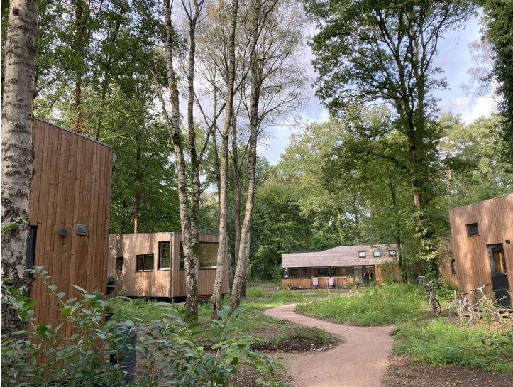
Een voorbeeld van een Tiny house dorpje