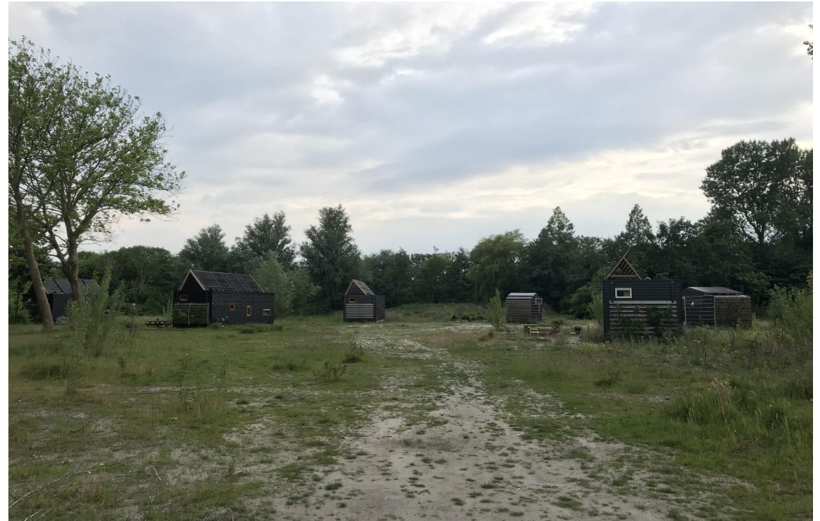
Tiny Houses aan de Zwemmerslaan