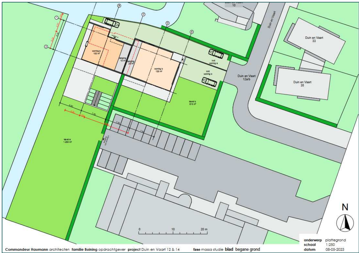
Figuur 1.5 Visuele representatie van de beoogde situatie (bron: Commandeur Haumann Architecten).