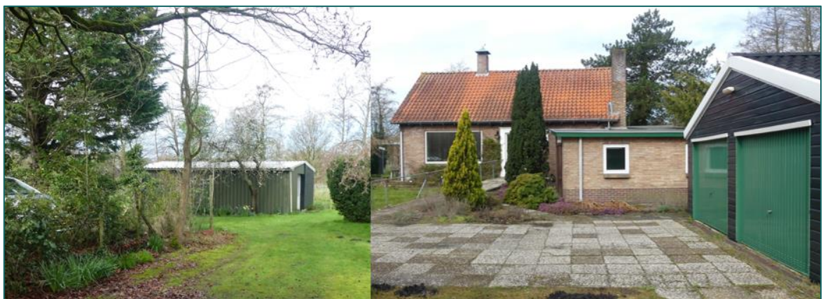
Figuur 1.3 Op de planlocatie is men voornemens om de woning en garage (rechts) en de schuur (links) te slopen.

De directe omgeving van de planlocatie wordt gekenmerkt door een landgoed aan de westzijde, en bebouwd gebied van Heemstede aan de andere zijdes. Circa 960 meter ten westen ligt natuurgebied Kennemerland-Zuid en circa 400 meter ten westen is de Leidse vaart gelegen. Circa 130 meter ten oosten is de N208 gelegen.