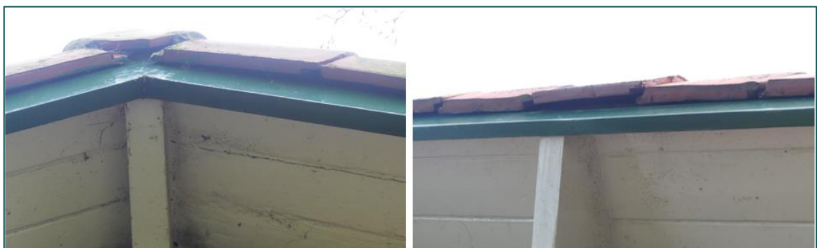
Figuur 3.3 Impressie van openingen in de te slopen woning en garage die voor huismussen kunnen dienen als (potentiële) nestlocaties.

De te slopen garage en schuur kennen een laag karakter en beschikken niet over openingen met achterliggende ruimte van voldoende grootte en een geschikte aanvliegroute. De te slopen woning is opgetrokken met een pannen zadeldak. De kantpannen bevatten openingen met voldoende grootte voor de gierzwaluw (figuur 3.3). Derhalve is er mogelijk sprake van het aantasten van nestlocaties van de gierzwaluw. Om de aan- of afwezigheid van nestlocaties van de gierzwaluw vast te stellen, dient derhalve een aanvullend onderzoek uitgevoerd te worden (zie H5.3 ).