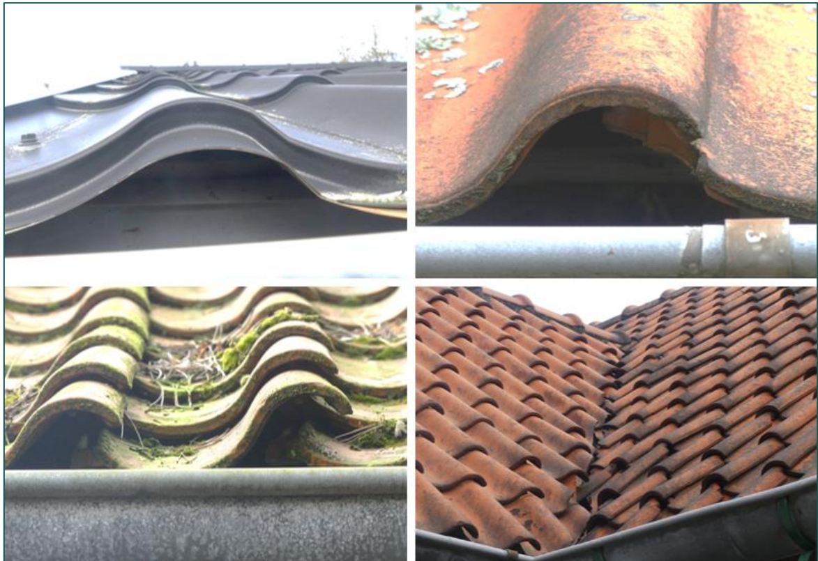
Figuur 3.2 Impressie van openingen in de te slopen woning en garage die voor huismussen kunnen dienen als (potentiële) nestlocaties.

De gierzwaluw heeft als oorspronkelijk rotsbewoner de rotsen ingeruild voor bebouwing. De soort broedt daardoor hoofdzakelijk in stedelijk gebied in donkere holtes van ventilatieschachten, spleten in muren en onder (pannen)daken (BLJ12 kennisdocument Gierzwaluw, 2017). Doordat de soort niet direct vanuit zijn nest kan opstijgen, moet hij zich naar beneden kunnen laten vallen. Het nest dient hierdoor een vrije aanvliegroute van minimaal 1 meter breed, en minimaal 3 meter onder de nestopening te bevatten. Hierbij dienen zo min mogelijk belemmerende elementen, zoals bomen, aanwezig te zijn. Voedselvluchten kunnen op vele kilometers (tot wel 1000 km) van het nest plaatsvinden, waardoor het foerageergebied niet nader te definiëren is.