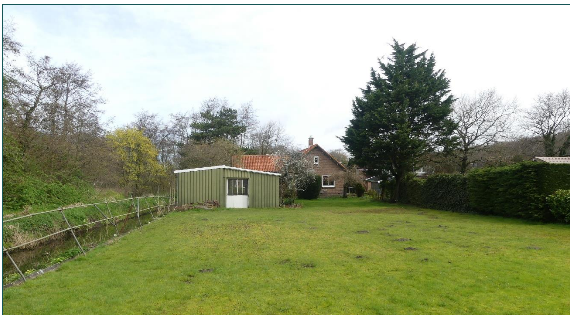
Figuur 1 De planlocatie is gelegen aan de Duin en Vaart 12 te Heemstede en bestaat uit een woning, garage en schuur. De foto weergeeft de zuidzijde van de woning, schuur en omliggende groen.