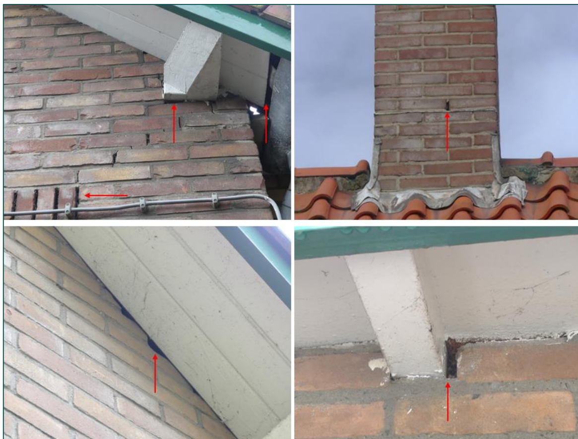
Figuur 3.1 Impressie van potentiële invliegopeningen voor vleermuizen in de te slopen woning.

De woning is opgetrokken uit gemetselde muren met spouw en een pannen zadeldak. De spouw en/of dakruimte zijn voor vleermuizen toegankelijk middels kierende kantpannen, openingen tussen de gevel en het dak en openingen in de gevels als scheuren, stootvoegen, ontbrekende specie en ventilatieroosters (figuur 3.1). De kierende kantpannen en openingen tussen de gevel en het dak zijn van voldoende grootte voor de laatvlieger. De aanwezigheid van verblijfplaatsen van gebouwbewonende vleermuizen kan in de woning derhalve niet uitgesloten worden.