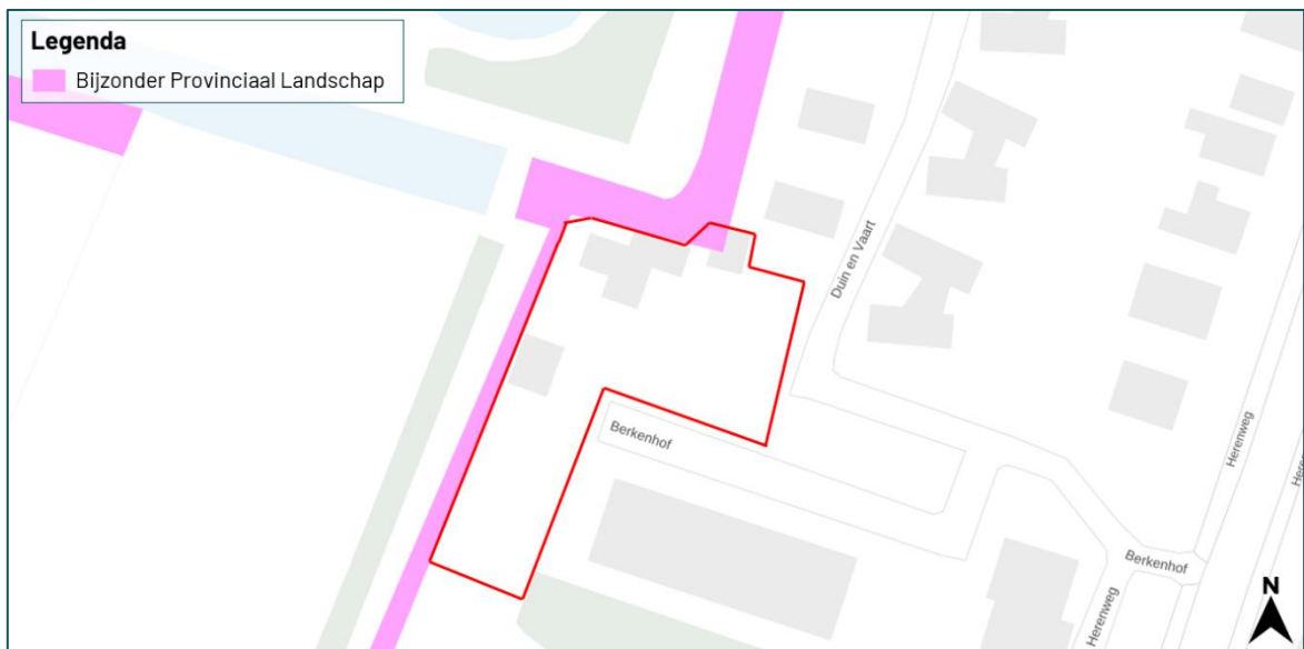
Figuur 3.6 De planlocatie grenst aan het Natuurwerk Nederland die betrekking heeft op de watergang.