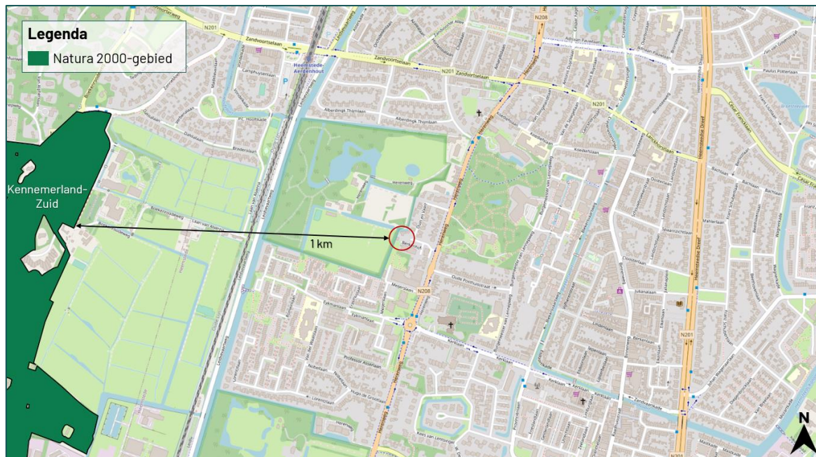
Figuur 3.4 De planlocatie ligt op een afstand van circa 1 km tot het Natura 2000-gebied 'Kennemerland-Zuid'.

De planlocatie maakt geen deel uit van een Natura 2000-gebied. Op een afstand van circa 1 km ligt het Natura 2000-gebied 'Kennemerland-Zuid' (figuur 3.4).