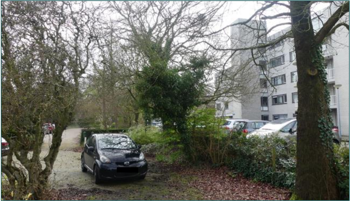
Figuur 1.4 Fotografische indruk van de omgeving van de planlocatie.