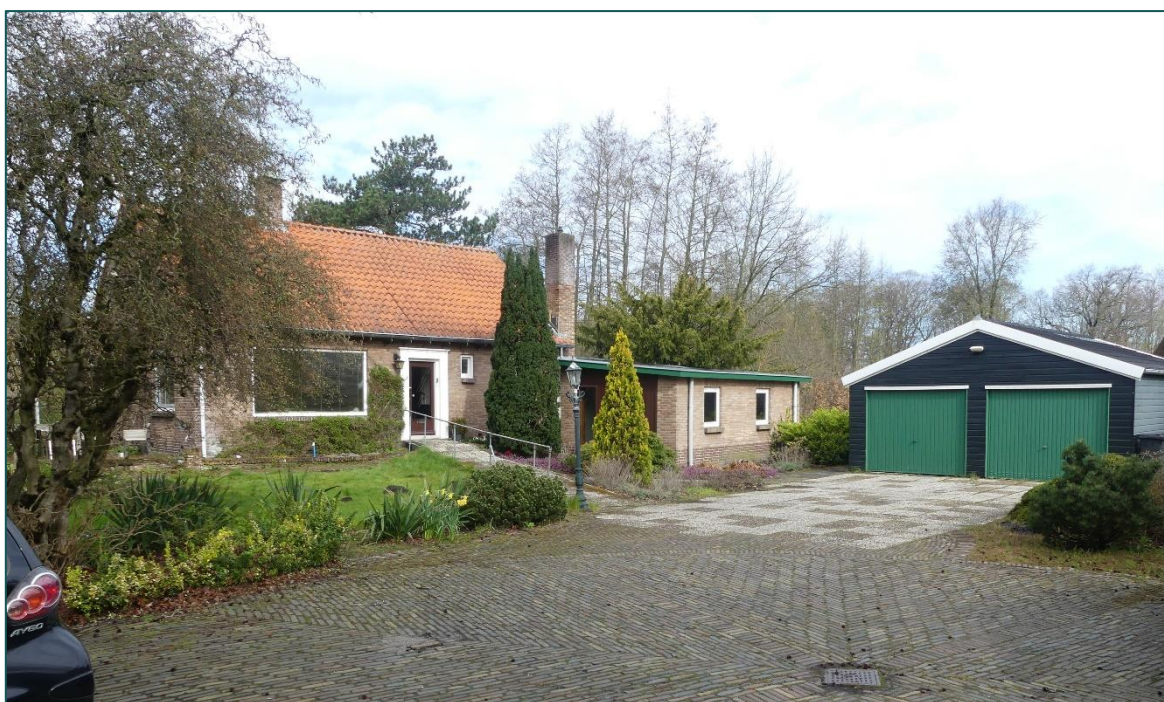
Figuur 2 Impressie van de oostzijde van de woning en garage. Binnen de beoogde ruimtelijke ingreep komen de weergegeven groenstructuren mogelijk te vervallen.