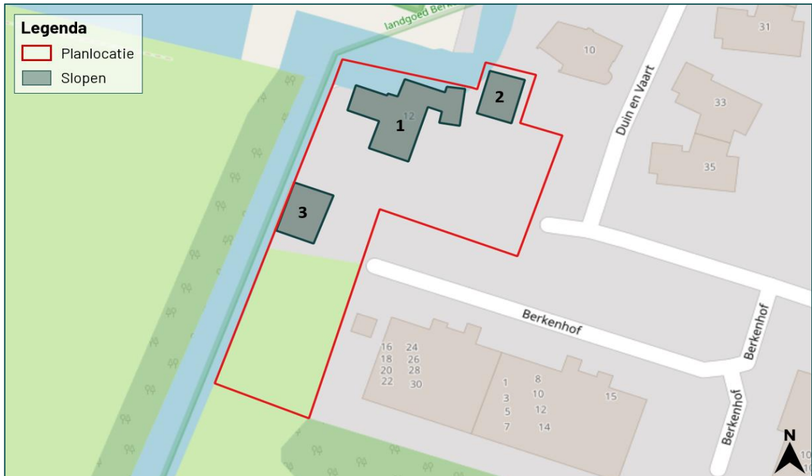
Figuur 1.2 De planlocatie (rood omkaderd) is gelegen aan de Duin en Vaart 12 te Heemstede waarbij op de planlocatie een woning (1), garage (2) en schuur (3) aanwezig is.

De planlocatie is gelegen aan de Duin en Vaart 12 te Heemstede (figuur 1.2). De planlocatie bestaat uit een woning, garage, schuur en tuin. De woning is opgetrokken uit gemetselde muren met spouw en een pannen zadeldak. Aan de woning is een uitbouw gesitueerd dat opgetrokken is uit gemetselde muren met spouw en een plat dak. De garage is opgetrokken uit houten gevelplaten en golfplaten zadeldak met dakbeschot. De schuur is opgebouwd uit deels hout en deels damwand gevels en zadeldak zonder dakbeschot. De tuin is voorzien van verhard terras, gazon, diverse struiken, twee kleine vijvers en drie grote naaldbomen. De naaldbomen zullen in de beoogde situatie gekapt worden. Aan de noord- en westzijde van de planlocatie is een sloot gelegen waarbij de oevers volledig beschoeid zijn. De sloot komt uit op de Leidse vaart. In figuur 1.3 en bijlage 1 zijn een aantal foto's opgenomen die een impressie geven van de planlocatie en de directe omgeving hiervan.