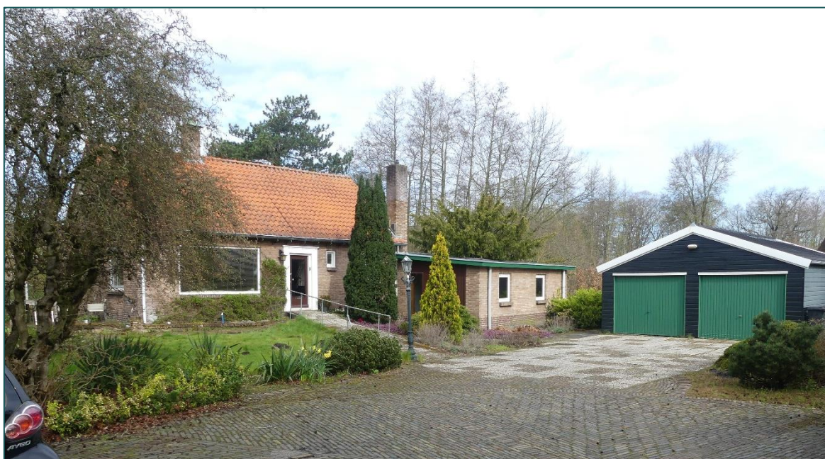
Figuur 1.1 De planlocatie is gelegen aan de Duin en Vaart 12 te Heemstede.