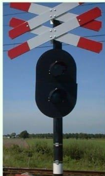
Er nadert een trein.

Foto: Overweg 61.0 baanvak Utrecht-Arnhem bij splitsing De Haar t.h.v. FINA-pomp aan de A12