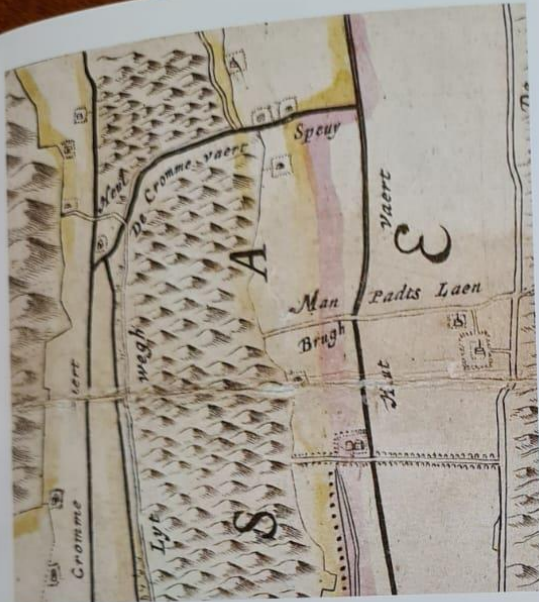
1647 Fragment (uitvergroot) uit de kaart van J. Douw en S. van Brouckhuijsen