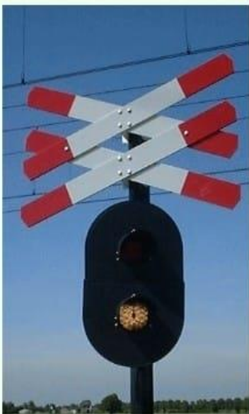
Geen trein in de aankondiging

Deze overwegen zijn eigenlijk vereenvoudigde AKI's. Als de witte lamp knippert, is er geen trein in de aankondiging. Als de rode knippert, is er wel een trein op komst. In tegenstelling tot de AKI knippert hier maar 1 rode lamp, en is de overweginstallatie niet voorzien van een bel. Tevens is bij deze overweg altijd maar 1 knipperende lamp zichtbaar. Bij de AKI zie je ook de paal aan de overkant van de weg nog knipperen.