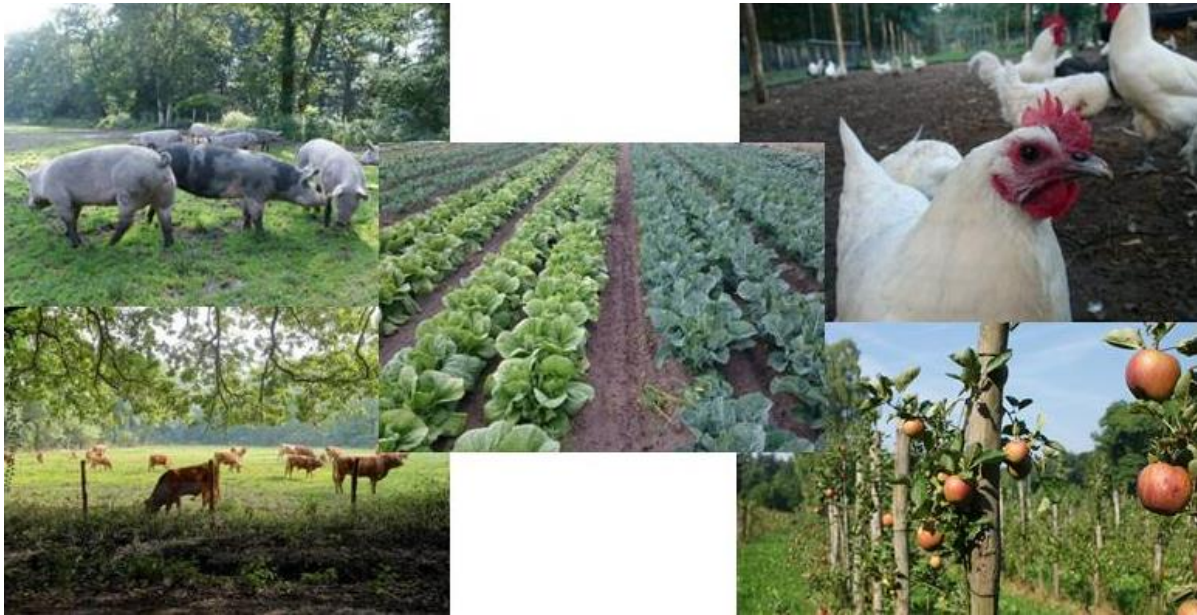
Sfeerbeelden van een Herenboerderij

De gewenste ontwikkeling past binnen de ruimtelijke kenmerken van het gebied 'Landgoederen en groene gebieden'. De ontwikkeling leidt niet tot een onevenredige aantasting van een goede ruimtelijke ordening ter plaatse. Vanuit ruimtelijke overwegingen doen zich geen beperkingen voor ten aanzien van het plan. Voor het overige bestaan geen argumenten die het verlenen van medewerking aan de gewenste ontwikkeling niet rechtvaardigen.