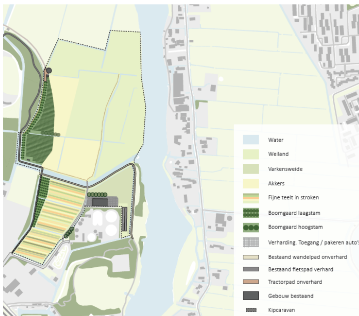
Indeling Herenboerderij (zie bijlage 1 voor details)