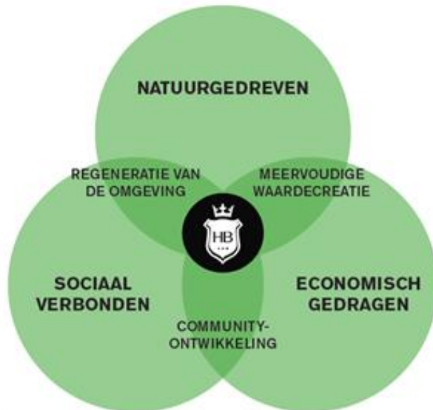
De drie principes van Farming Communities

Herenboeren werken natuur gedreven, sociaal verbonden en economisch gedragen. Het perspectief van waaruit we werken is uitgeschreven op https://www.herenboeren.nl/de-beweging/farming-communities/ .