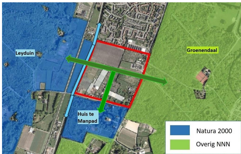
Plangebied als belangrijke schakel tussen de drie beschermde natuurgebieden en langs de Leidsevaart

Een juiste situering van de woningbouw is daarbij van cruciaal belang voor het behoud en versterking van natuurwaarden. Met deze notitie dragen we daarvoor bouwstenen aan.