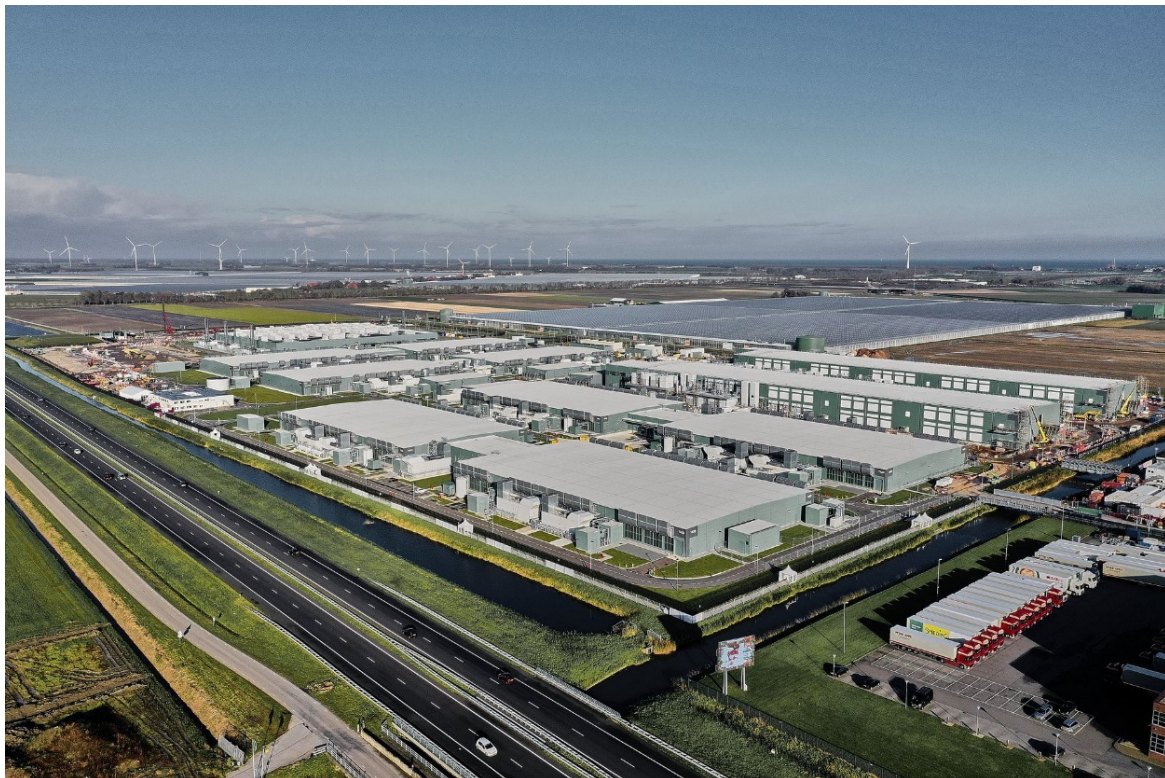
Overzicht situatie Datacenter Middenmeer 70 ha